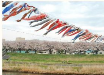
卸商団地の釈迦堂川の桜とこいのぼり

以後、幾多の困難はありましたが、それを乗り越えて集団化の基盤を固め、流通サービス業の中核基地としての役割を担っております。