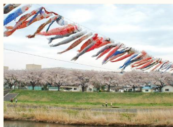
卸団地隣の釈迦堂川の桜とこのぼり

以後、幾多の困難はありましたが、それを乗り越えて集約化の基盤を固め、流通サービス業の中核基地としての役割を担っております。